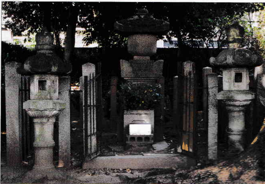
Stânga: Mormântul lui Imagawa Yoshimoto. El a fost primul daimyō care l-a subestimat pe Oda Nobunaga, vecinul lui mai tânăr. Bătălia de la Okehazama, din 1560, avea să fie epitaful lui Yoshimoto.

Yoshimoto dormea în cortul lui când a fost trezit de agitația de afară. Crezând că sunetele sunt scoase de propriii oameni care sărbătoreau, Yoshimoto s-a repezit afară din cort ca să le ceară să facă liniște. Când a ieșit, a văzut un samurai Oda venind în fugă cu o sulită îndreptată spre el. În timp ce își căuta sabia, un alt soldat Oda l-a decapitat. Rămase fără lider, trupele Imagawa s-au risipit care încotro, lăsând în urmă zeci de cadavre.